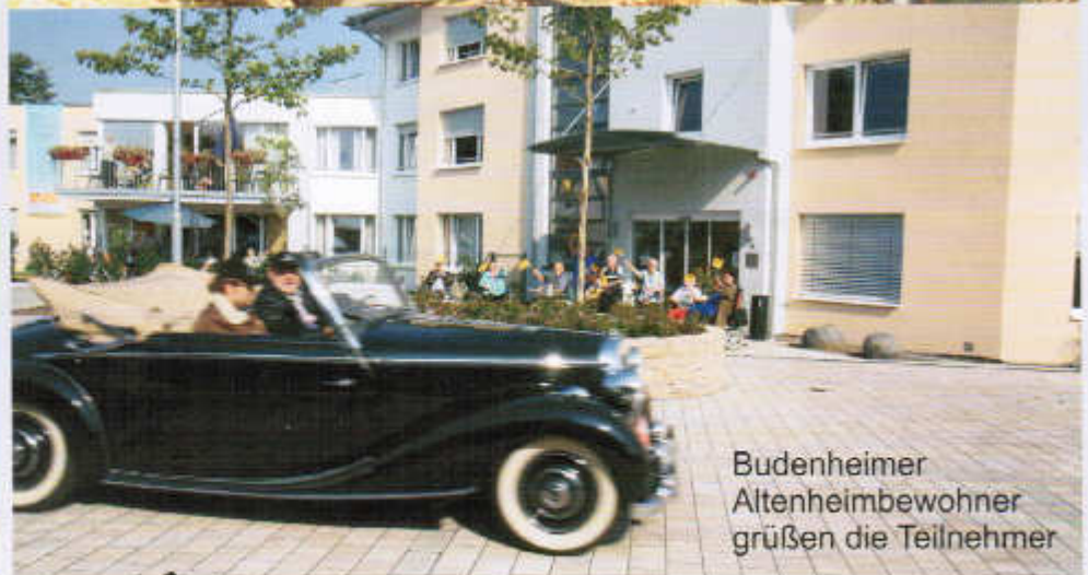
Budenheimer Altenheimbewohner grüßen die Teilnehmer