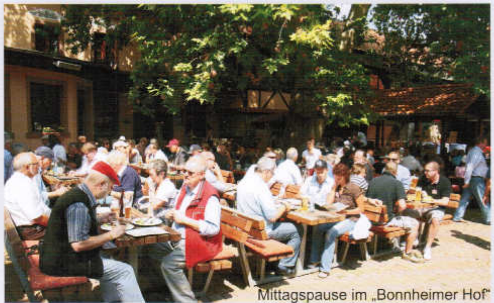
Mittagspause im „Bonnheimer Hof“