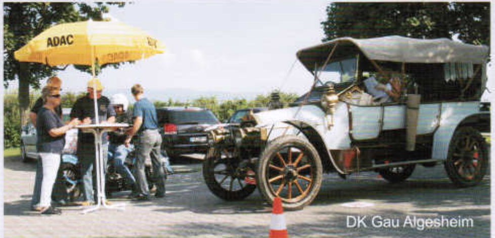
DK Gau Algesheim

Pünktlich wie geplant begann die Siegerehrung, unterteilt in einzelne