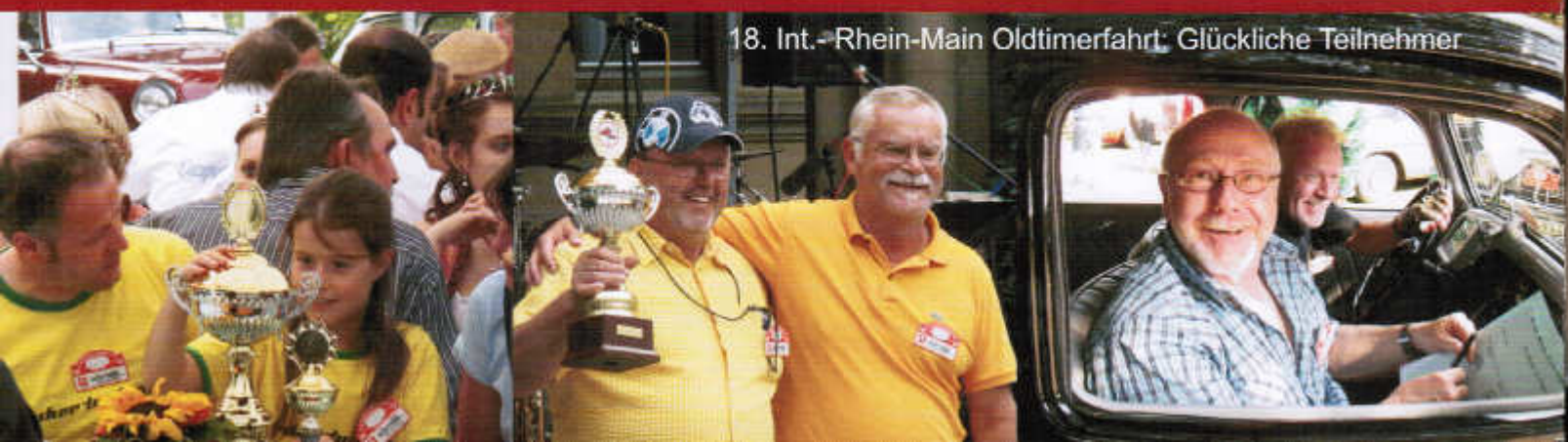
18. Int.-Rhein-Main Oldtimerfahrt: Glückliche Teilnehmer