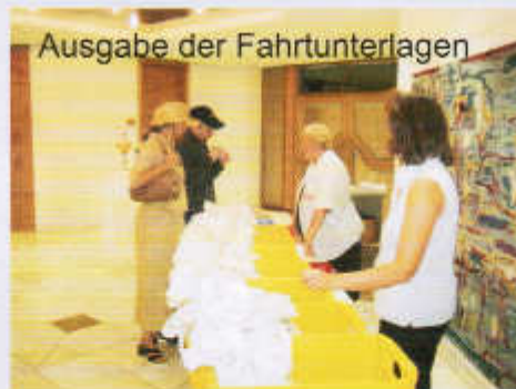
Ausgabe der Fahrtunterlagen