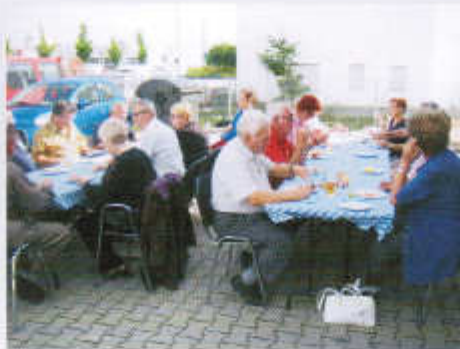
Mitglieder beim Essen