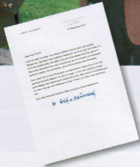
Auszug aus dem Dankschreiben